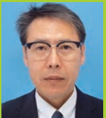
森山 潤 兵庫教育大学大学院 学校教育研究科 教授