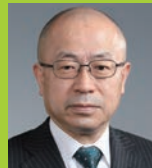
林 泰成 上越教育大学長